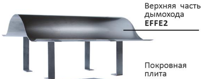
Верхняя часть дымохода EFFE2

ДЛЯ КОТЛОВ, РАБОТАЮЩИХ НА ЖИДКОМ ИЛИ ГАЗООБРАЗНОМ ТОПЛИВЕ