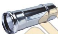
Соединительный элемент с отверстием + соединительный фитинг