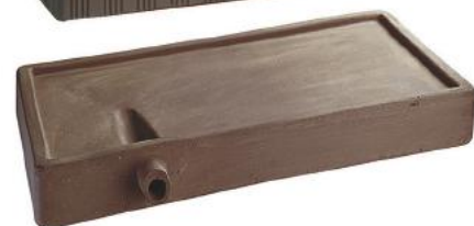
Поддон для сбора конденсата