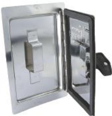
Элемент со смотровым окошком